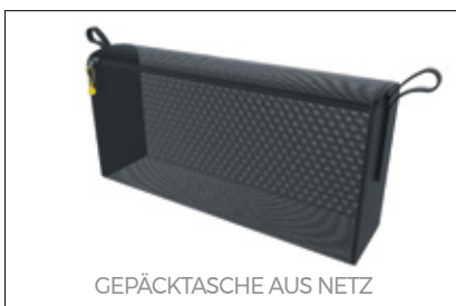
GEPÄCKTASCHE AUS NETZ