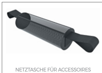
NETZTASCHE FÜR ACCESSOIRES