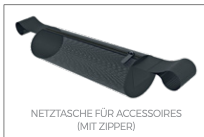
NETZTASCHE FÜR ACCESSOIRES (MIT ZIPPER)